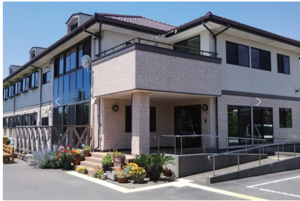
グループホーム ふれ愛