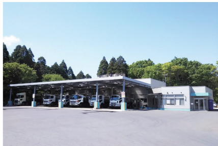
生乳集荷配送センター (三和酪農C・S)