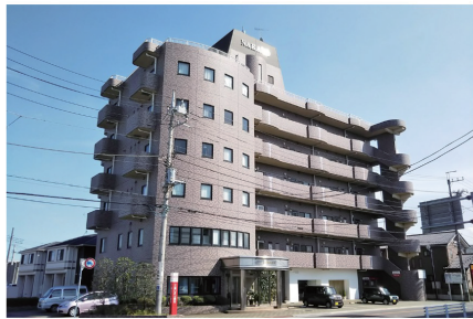
複合ビル (事務所・店舗・マンション)