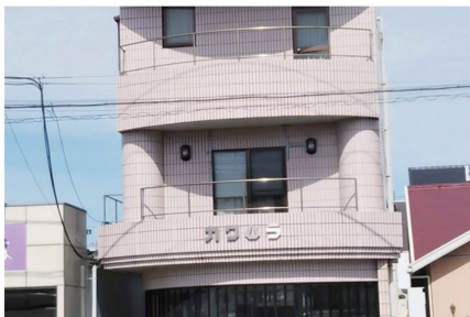
フラワーショップ