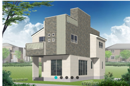
戸建住宅実例パース