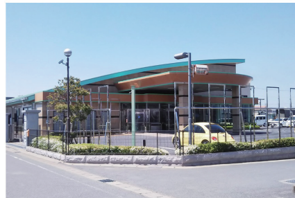
セレモニーホール