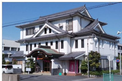
日本料理店、日本庭園